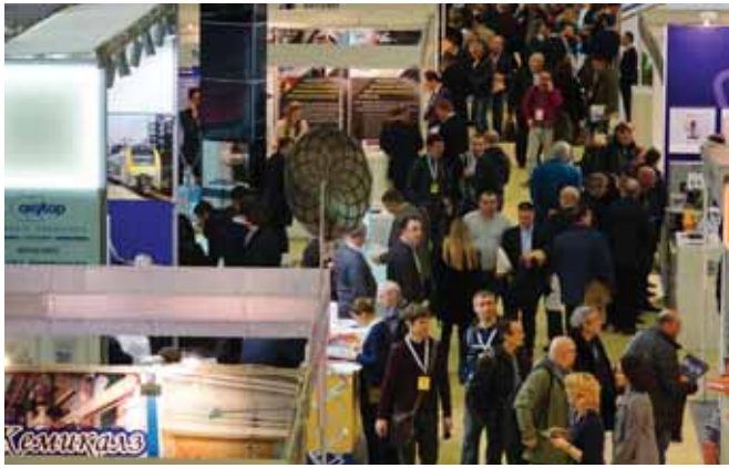
Фото 1. Павильон № 1 ЦВК «Экспоцентр», заполненный посетителями во время проведения выставок «Композит-Экспо-2017» и «Полиуретанэкс-2017»

шения находят те участники, чей бизнес связан с обоими тематическими направлениями. Примерами служат компании Covestro (в пятый раз участвует в выставке «Полиуретанэкс») и KraussMaffei Technologies («новичок»). Для первой из них, выделившейся из концерна Bayer, в рамках которого, собственно, и был изобретен ПУ, «полиуретановое» направление как бы по «наследству» является одним из основных среди прочих, и среди прочего немаловажное место занимает разработка ПУ-связующих для ПКМ. Представленное на выставке бизнес-подразделение второй компании разрабатывает реакционные технологии и оборудование для производства изделий из ПКМ, для которых распространенной матрицей служит полиуретан – материал, «удачный» для крупносерийного производства благодаря высокой скорости отверждения. Забегая вперед, можно добавить, что обе компании остались довольны итогами выставок и планируют участвовать в них и в следующем году.