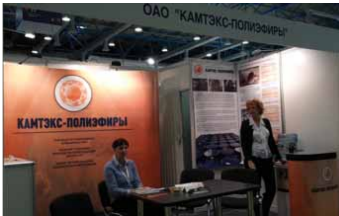
Фото 2. Стенд ОАО «КАМТЭК-ПОЛИЭФИРЫ» готов к приему посетителей. Эта экспортно-ориентированная компания, организованная в 1998 г., производит высококачественные ненасыщенные полиэфирные смолы для связующих ПКМ