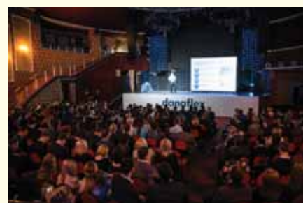
В зале проведения конференции

После конференции участники были приглашены на экскурсию по производственной площадке Danaflex в Казани, а вечер закончился в приятной атмосфере гала-ужина, где гости могли продолжить деловое общение и просто дружеские беседы. Нужно заметить, что именно это и было одной из главных задач организаторов кон-