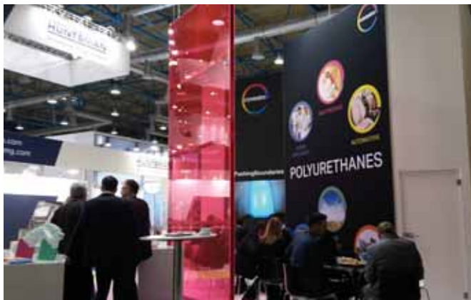
Фото 6. Стенд компании Covestro, для которой выставка «Полиуретанэкс» является профильной: более 50 % от всего оборота приходится именно на «полиуретановое» направление деятельности, в котором компания специализируется со времени создания ПУ