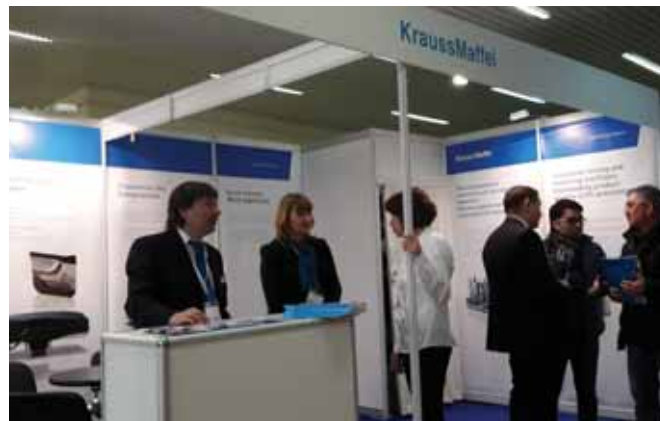
Фото 7. Стенд компании KraussMaffei Technologies – «новичка» выставки «Полиуретанэкс», подразделение реакционных технологий которой специализируется на разработке и поставке технологий и оборудования для производства материалов на основе монолитных и вспененных ПУ

Комплекс» и др. Впервые приняли участие в выставке компании KraussMaffei Technologies (фото 7), «Адамантан», «Марис Полимерс», «Плэйн Кемикалз», «Уральский завод полимерных материалов и др. Дополнил выставку ее традиционный специальный раздел «Клеи и герметики».