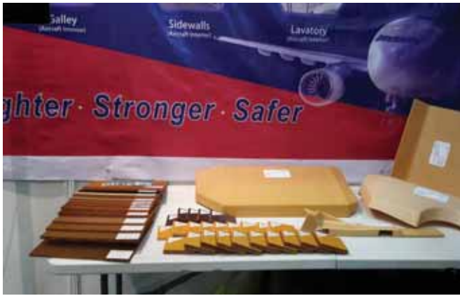
Фото 4. Образцы трехслойных панелей интерьера пассажирских самолетов и сотовых заполнителей на объединенном стенде российской и китайской компаний-партнеров – «Центра авиационных технологий и интерьера» и Aramicore Composite