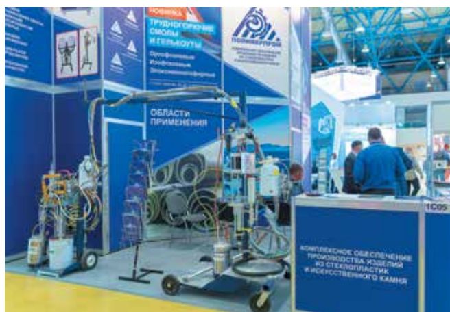
Рис. 3. Стенд ООО «ПОЛИМЕРПРОМ» непосредственно перед открытием выставки «Композитэкспо-2021»: на переднем плане – установка для напыления смолы с рубленым стеклоровингом модели Ultra MAX

на стенде которого был представлен ассортимент продукции как собственного производства, так и от зарубежных партнеров (MVP, Chomarar, Lantor, Jiangsu Changai Composite Materials Holding Co., Chem-Trend, Mirka Ltd, ES Manufacturing) (см. рис. 3). Внимание посетителей среди прочего привлекли образцы высокотехнологичного оборудования, поставляемого на российский рынок от компании MVP (США), – установок для напыления смеси полиэфирной смолы с рубленым стеклоровингом модели Ultra MAX и для нанесения полиэфирных шпатлевок модели Patriot Chop/Check Putty System. В числе новых продуктов собственного производства – трудногорючие смолы и гелькоуты, полиэфиракрилатные смолы и эпоксивинилэфирная система, предназначенная для быстрого изготовления полимерной оснастки. Помимо этого, компания предлагает российским производителям изделий из полимерных композитов широкий ассортимент продукции: ненасыщенные полиэфирные смолы общего и специального назначения, гелькоуты, окрашенные в цвета по каталогу RAL, стекломаты, стеклоткани, ровинги, антиадгезионные разделительные вещества и др., уделяя особое внимание поддержке в технологических вопросах и обслуживании оборудования, помощи в разработке новых технологий и модернизации существующих производств. Компания имеет успешный опыт организации на площадях заказчика производства стеклопластиковых изделий «под ключ» с обеспечением оборудованием, оснасткой и материалами.