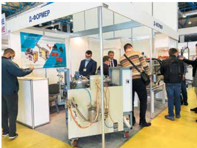
Рис. 1. Стенд ООО «Д-Формер» – компании, специализирующейся на разработке и изготовлении смесительно-дозировочных машин для переработки полиуретановых систем

Примером компании, традиционно принимающей участие в этой выставке, является ООО «Полимерпром»,