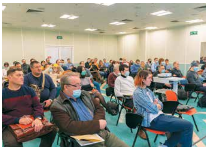
Рис. 6. Участники конференции «Практические аспекты применения композитных материалов в различных отраслях промышленности»

За время работы прошедших выставок участники выставок провели множество переговоров с возможными заказчиками, установили новые деловые контакты и обсудили новые проекты с представителями различных отраслей. Вот лишь несколько отзывов экспонентов «Композит-Экспо-2021».