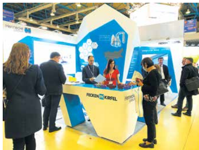
Рис. 2. Стенд компании Henpke, обладающей более чем 70-летним опытом разработки оборудования для всех базовых технологий производства пенополиуретана и изделий на их основе